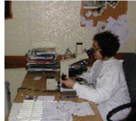
7. Microscopia das lâminas