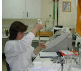
6. Realização de técnicas imunocitoquímicas