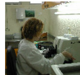
4. Cortes em micrótomo Minot