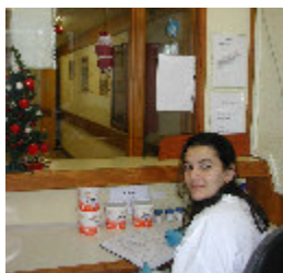
1. Recepção e registo