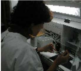
5. Montagem e identificação de lâminas