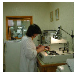
3. Inclusão de fragmentos em parafina