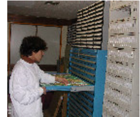
8. Armazenamento dos blocos e lâminas