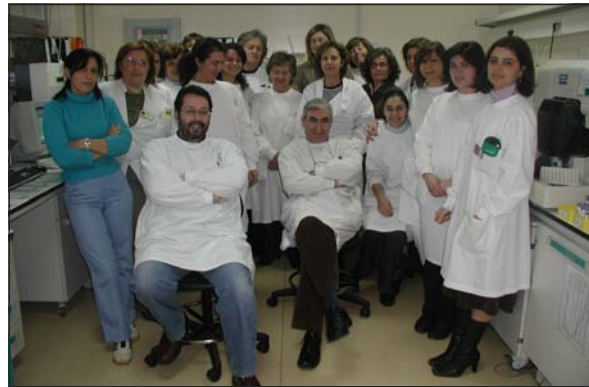
Alguns dos elementos que integram a equipa responsável pela obtenção da Acreditação.

O Instituto Português de Acreditação (IPAC) emitiu, em Janeiro último, o Certificado L0371, através do qual declara que o Serviço de Patologia Clínica desta Instituição “cumprir com os critérios de acreditação para Laboratórios de Ensaio e Calibração estabelecidos na Norma Portuguesa EN ISO/IEC 17025:2000”, dando assim por concluído um longo processo iniciado em 2002. A acreditação agora atribuída incide simultaneamente sobre as vertentes técnica e organizativa, comprovando a existência no terreno de um sistema de controlo e gestão da qualidade, cujo funcionamento acarreta benefícios quer para os utentes quer para os próprios profissionais. O processo obrigou a uma profunda remodelação e reorganização do Serviço, implicando alterações do espaço físico, mas também a substituição e actualização de equipamentos e a revisão das próprias metodologias de trabalho, com ganhos significativos ao nível da eficiência e da segurança. Em termos práticos, os resultados traduzem-se, para os utentes, em melhores condições de atendimento, redução do tempo médio de espera e aumento dos níveis de confiança no serviço