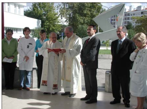
D. Manuel Pelino, Bispo de Santarém, presidiu à missa solene evocativa dos 20 anos de vida da Instituição, que se realizou no dia 4 de Novembro e à qual se seguiu o ritual de benção do edifício.

À direita, uma imagem que ilustra a acção de rastreio promovida pelos enfermeiros do HDS junto da população, na qual participaram cerca de 600 pessoas.